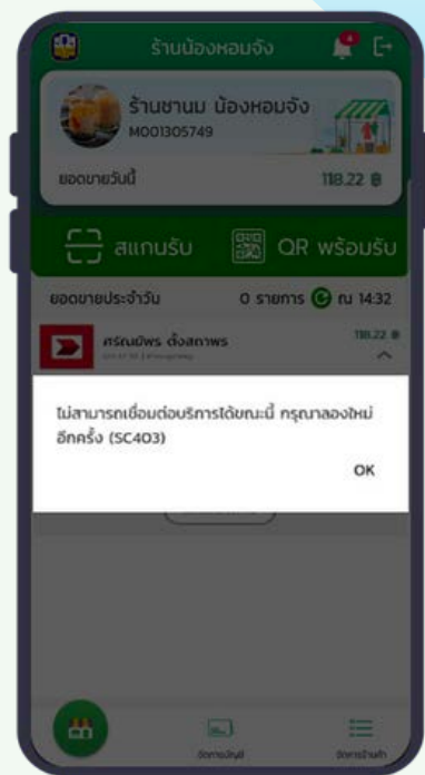
กรณียกเลิกรายการไม่สำเร็จ

2) กรณียกเลิกการขายสินค้าไม่สำเร็จ (ระบบขัดข้อง/ปัญหาการเชื่อมต่อ) ระบบจะแสดงข้อความ “ไม่สามารถเชื่อมต่อบริการได้” โดยระบบจะไม่บันทึกรายการ Void และร้านค้าสามารถทำรายการ Void ใหม่ได้