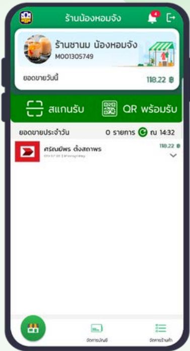
1. หน้าจอร้านค้าที่แสดงยอดขายประจำวัน

1) ขั้นตอนการยกเลิกการขายสินค้า (Void) กรณีชำระเงินภายในประเทศ โดยเงินจะกลับเข้าไปยังผู้ซื้อในทันที