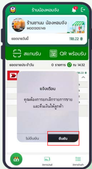
3. ระบบแสดงข้อความแจ้งเตือน “คุณต้องการยกเลิกรายการขายและคืนเงินให้ลูกค้า” หากต้องการยกเลิกรายการให้กดปุ่ม “ยืนยัน” หากไม่ต้องการให้ยกเลิกรายการให้กดปุ่ม “ไม่ยืนยัน”